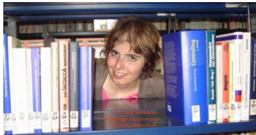
>> Auf wissenshungrige Absolventen hofft die Wirtschaft.